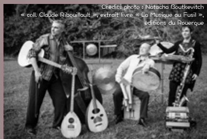
Crédits photo : Natacha Boutkevitch « coll. Claude Ribouillault », extrait livre « La Musique au Fusil », éditions du Rouergue

Pour cette nouvelle création, Laurent Cabané explore différents chemins pour aborder les thèmes de la paix et de la guerre avec des compositions musicales autour de textes allant de la gravité à l'humour en passant par l'indignation, la révolte et la dérision. Rimbaud, Brassens, Prévert y côtoient des textes plus populaires écrits par des soldats au combat. Si le spectacle s'apparente à un tour de chant, il fait également la part belle à des instruments peu communs tels : le nyckelharpa suédois, le oud oriental, le bendir maghrébin, le gong chinois, la senza africaine, le cajon espagnol et le buzuk syrien, qui, mêlés aux voix du trio et aux autres instruments plus classiques : contrebasse, violon, accordéon, clarinette, guitare, illustrent l'idée que la paix est aussi une question d'acceptation de nos différences.